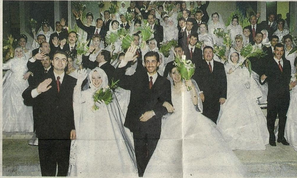
BAHAGIA... melalui perkahwinan yang sah, suami dan isteri yang bekerja mempunyai peranan masing-masing dalam rumah tangga.

Faktor-faktor itu menyebabkan institusi kekeluargaan menjadi rapuh. Tiada rasa kasih sayang antara suami isteri dan anak-anak yang masih kecil. Hubungan kasih sayang dan tanggungjawab dalam keluarga wajar diperkukuhkan sebelum kedua-dua pasangan suami isteri melangsungkan perkahwinan.